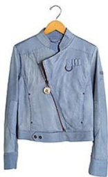
R$ 2 722,00 Jaqueta feminina azul de pelica