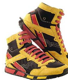
R$ 920,00 Tênis de camurça e náilon