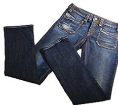
R$ 1 276,00 Calça feminina keate