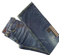
R$ 2 350,00 Jeans de série limitada denim gallery