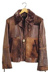
R$ 5 105,00 Jaqueta masculina de pelica forrada com pele