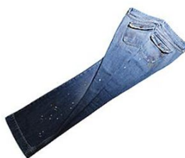
R$ 1 205,00 Calça wadaç com respingos de tinta