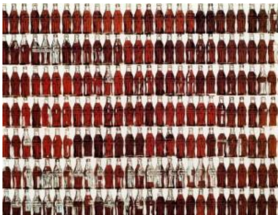
Green Coca-Cola Bottles, 1962.

Cultura de massa: segundo a definição de Ecléa Bosi, a cultura de massa é constituída por um sem número de imposições ditadas pelos meios de comunicação, na maioria das vezes, sendo as mesmas para as mais diferentes regiões e povos. Desse modo, pode-se explicar que as massas, em diferentes continentes, apreciem e produzam a mesma arte, vistam as mesmas roupas, gostem das mesmas comidas (Ecléa Bosi. Cultura Massa e Cultura Popular).