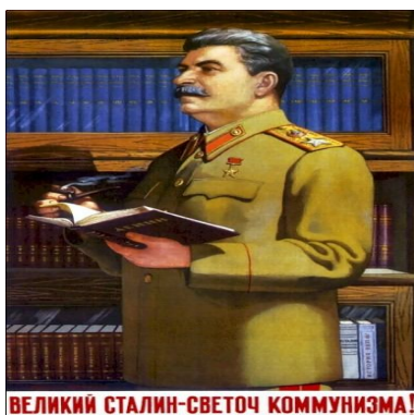
Tradução da Frase: O grande Stálin é a luz do comunismo!