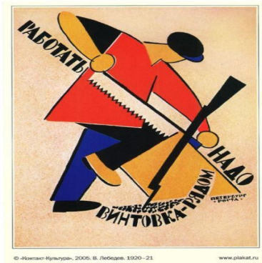
É necessário trabalhar. A arma está ao lado.