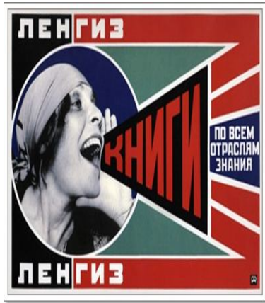
Mulher grita: Livros!