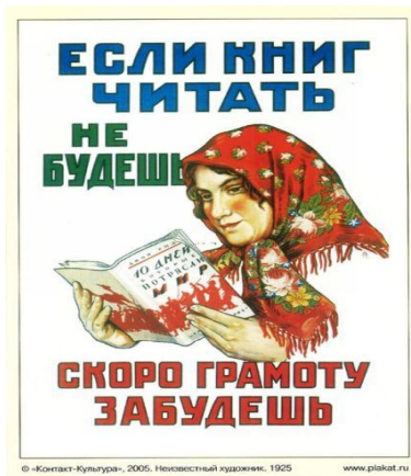
Tradução da Frase: Se você não ler os livros, esquecerá as letras.