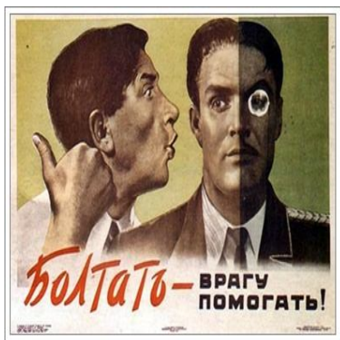
Tradução da Frase: Falar muito é ajudar o inimigo.