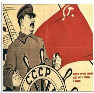
Stálin – O Comandante da Nação